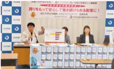
組合員の願いを記者会見で発信