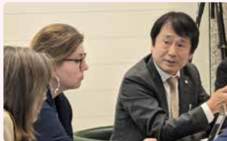
国際労働機関 (ILO) との懇談