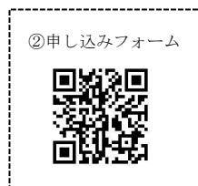
②申し込みフォーム